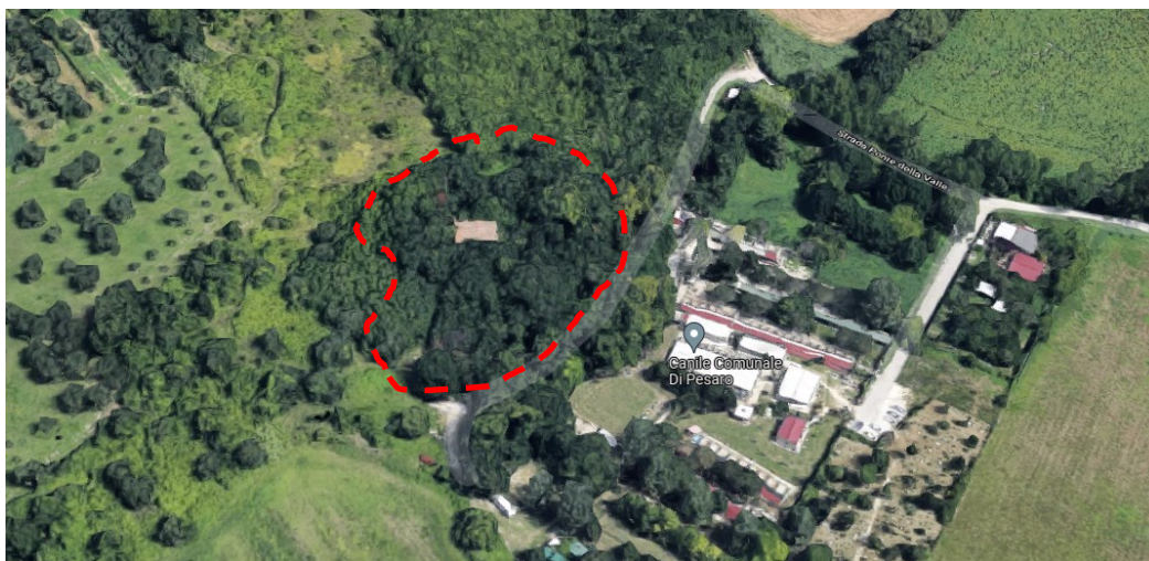
2.7 Terreno San Nicola, Pesaro (PU)